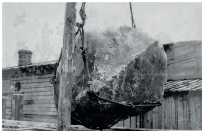
Рисунок 2. Кристалл горного хрусталя «Юбилейный- II». Размеры 1,6 × 1,5 × 1,5 м; вес 3,4 т. Светлинское месторождение пьезокварца, участок «II-Водораздельный». 1967 г. [5]

В годы Великой Отечественной войны Урал стал главной сырьевой базой по добыче пьезооптического кварца. Особенно интенсивно отрабатывалось открытое перед самой войной Светлинское месторождение пьезокварца [4], обеспечивавшее нашу оборонную промышленность наиболее высокосортным сырьем (рис. 2).