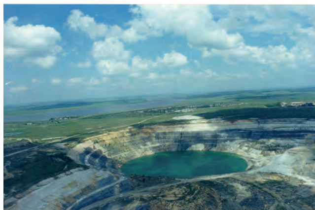
Рисунок 3. Добычный карьер на участке «Западный» Астафьевского месторождения пьезокварца. 2005 г.

Кроме благоприятных геолого-структурных особенностей в выбранных для проведения работ перспективных районах существенную роль для обнаружения месторождений сыграла распаханная в 1954–1955 гг. целинных земель на обширных территориях Южного Урала. Распаханные земли представляли собой идеально обнаженные участки целины, скрываемые ранее степной растительностью. На таких участках легко фиксировались при маршрутных поисках обломки кристаллосырья, что позволило легко найти целый ряд крупных кристаллопроявлений: Москов-