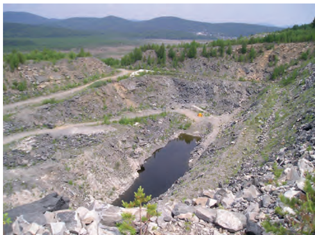
Рисунок 5. Добычный карьер на кварцевой жиле № 175 Кыштымского месторождения гранулированного кварца. 2004 г.

За полувековой период деятельности объединения на Урале открыто 6 месторождений пьезооптического кварца, 7 месторождений гранулированного кварца, 5 месторождений молочно-белого кварца, 2 месторождения прозрачно жильного кварца,