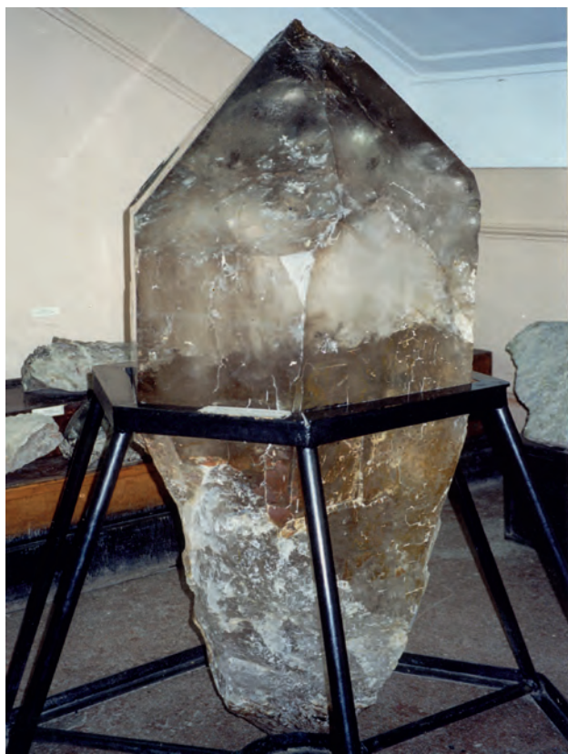
Рисунок 4. Кристалл горного хрусталя «Малютка». Высота 170 см, вес 784 кг. Теренсайское месторождение пьезокварца, участок «Джаман-Акжар». 1966 г.

За прошедшие 1978–1991 гг. объединение выросло в одну из