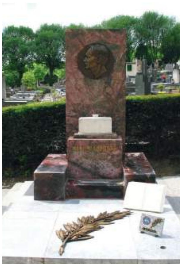
Рисунок 4. Памятник А. Барбюсу на кладбище Пер-Лашез.