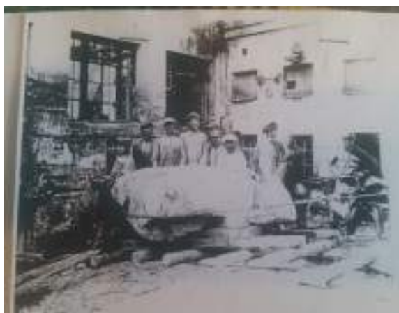
Рисунок 2. Двор гранитной фабрики. Мастера фабрики возле глыбы родонита.

себе, к людям, к обстоятельствам, образную форму которому дал советский поэт-романтик Павел Коган: «Я с детства не любил овал/Я с детства угол рисовал». В основании надгробья лежала прямоугольная плита-монолит; на ее краю вдоль короткой стороны находилось каре из разновысоких блоков, из которого вырастала вертикальная плита-стела.