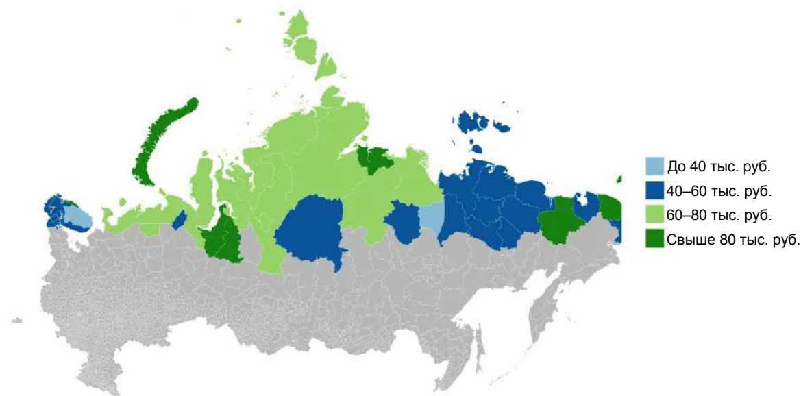
Рисунок 3. Дифференциация заработной платы наемных работников муниципальных образований Арктической зоны РФ. Figure 3. The differentiation of remuneration of labor of municipalities' workers of the Arctic zone of the Russian Federation.