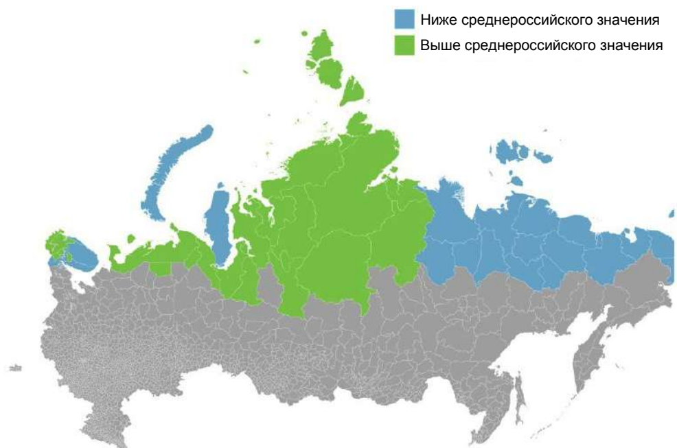
Рисунок 2. Дифференциация инвестиций в основной капитал муниципальных образований Арктической зоны РФ.

Figure 2. The differentiation of investments in the fixed capital of municipalities of the Arctic zone of the Russian Federation.