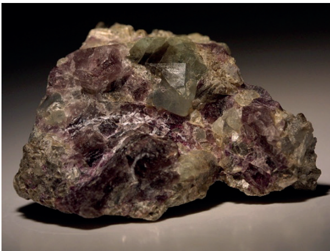
Рисунок 2. Кристаллы хризоберилла (зеленый) во флюорите (фиолетовый).