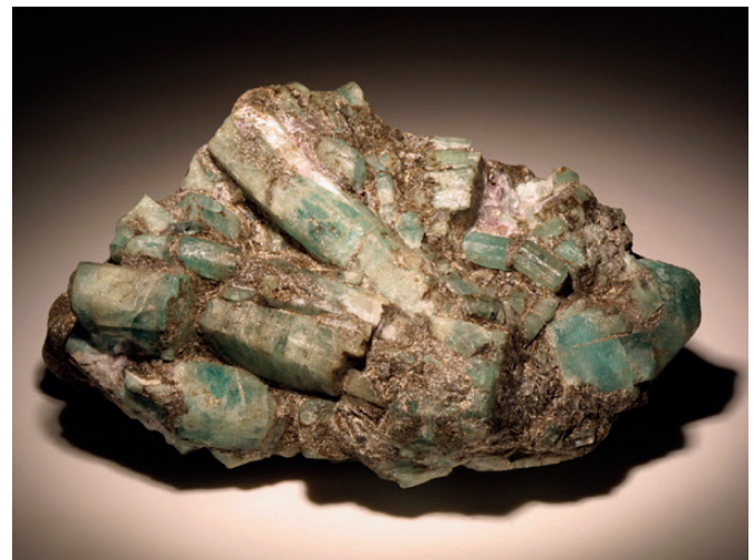
Рисунок 3. Выделения фиолетового флюорита среди зеленых кристаллов берилла.

формируется непосредственно в матрице апогипербазитового субстрата и имеет микроэлементный состав, характерный для многих серпентинитов [8].